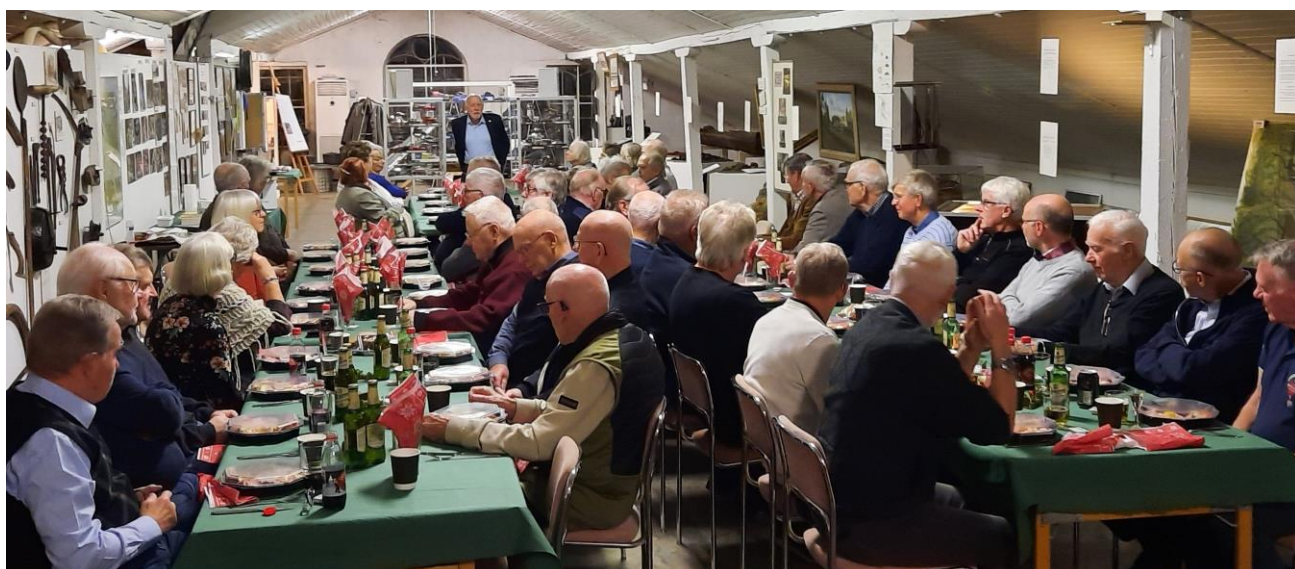
Jultallrik på industrimuseet 3 december.