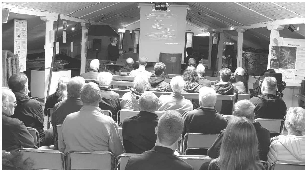
Bild 1: Astronomins dag.